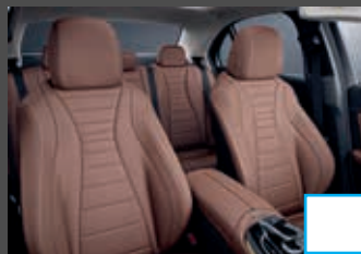
Nappalederen bekleding (8XX) (i.c.m. Business Solution AMG) € 2.662