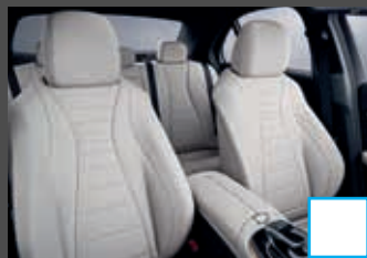
Lederen bekleding (2XX) (i.c.m. Business solution) € 2.093