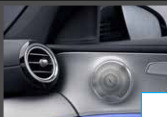
Burmester Surround Sound (810) € 1.029