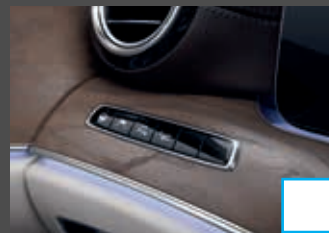
Rijassistentiepakket Plus (P20) € 2.904