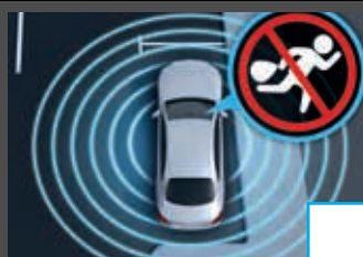
Antidiefstalpakket (P54) € 532