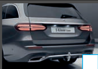
Trekhaak € 1.101